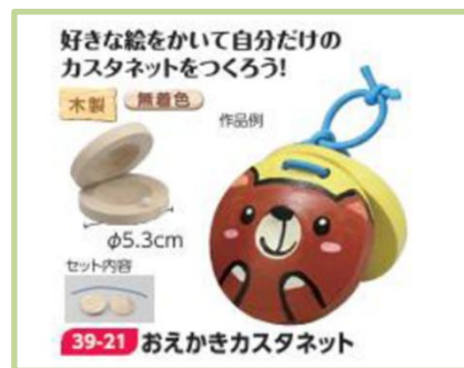
※写真はイメージです♪

第2部 音楽教室♪ 「自分だけのオリジナルカスタネットをつくろう♪」 講師：商工会議所・知多信用金庫職員